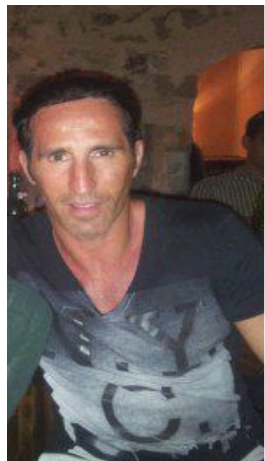
Photo de 2012, avec perruque